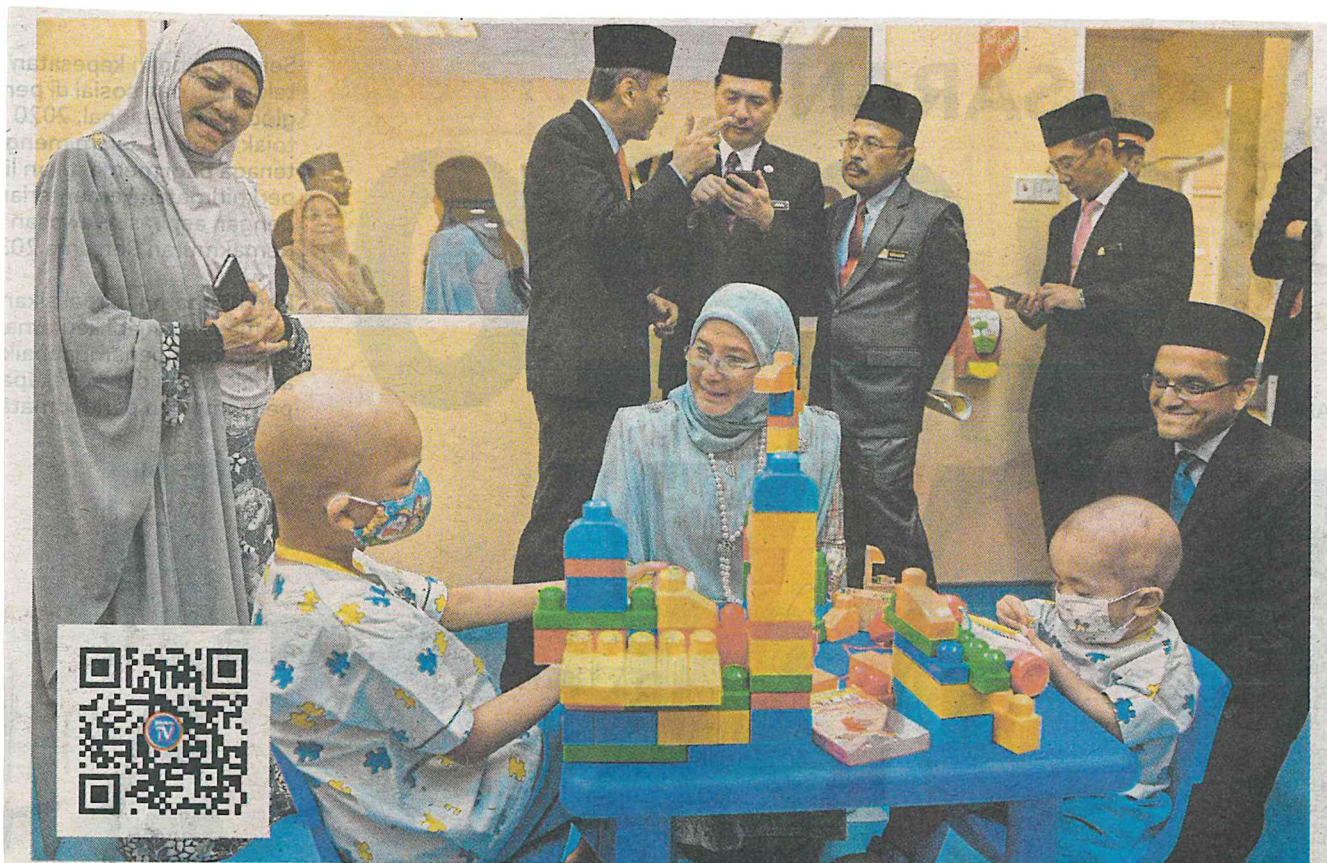
*TUNKU Azizah bersama pesakit kanak-kanak yang menerima rawatan di HTA, semalam.