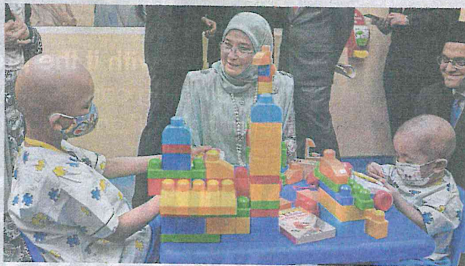
All for the children: Tunku Azizah visiting young patients at Tunku Azizah Hospital.