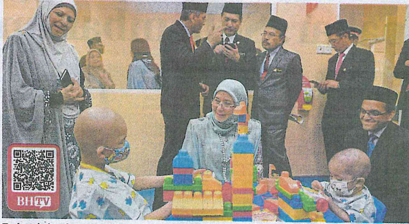
Tunku Azizah melawat pesakit kanak-kanak di HTA, Hospital Kuala Lumpur, semalam.